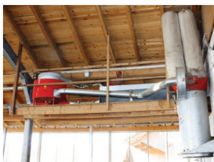
Unité de transfert et aspirateur